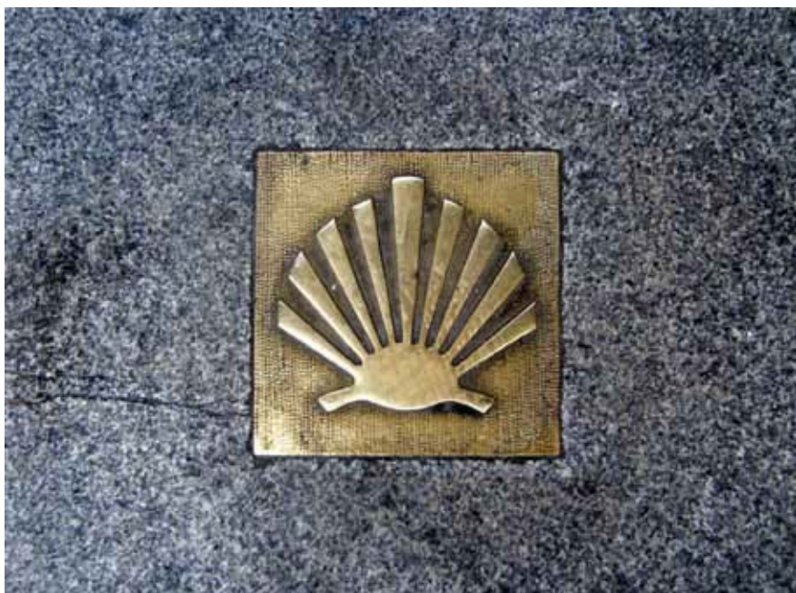
Jacobsschelp in de straat, als routemarkering voor langstreckende pelgrims