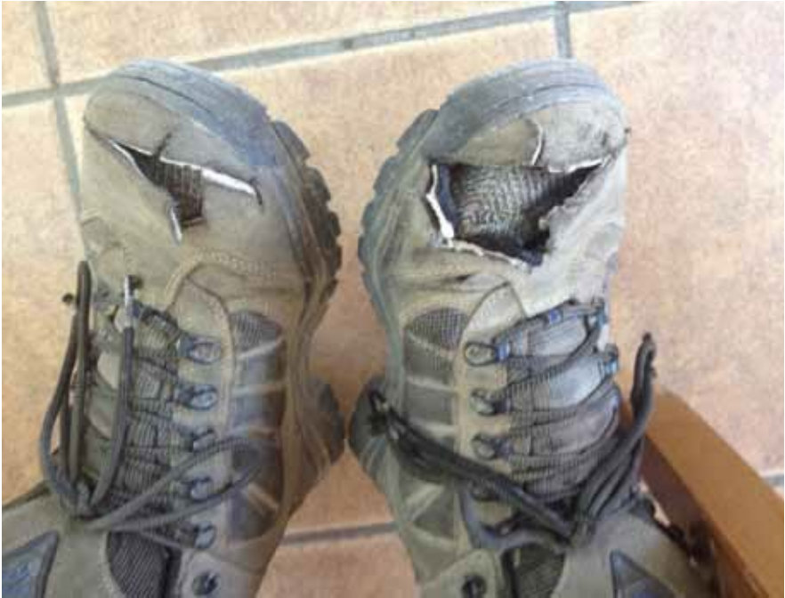
Schoenen van een eigenwijze rechter

Onderweg naar Burgos kwam ik in een particuliere herberg een Amerikaan tegen die nogal raar schoeisel had. Hij had de tenen van zijn 'wandelschoenen' opengeknipt omdat hij veel blaren en pijnlijke tenen had. Ik bood aan om even naar zijn voeten te kijken om te zien of ik ergens mee kon helpen.