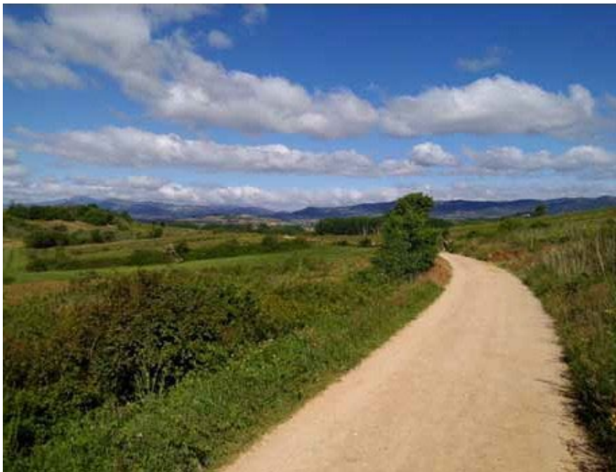
Het is de weg

opmerking keek hij mij lang en doordringend aan, nam een ferme slok van zijn bier en zei: “oK, lets go. Have it your way.” We bestelden een taxi, omdat lopen eigenlijk geen optie meer voor hem was, en gingen naar de dokterspost.